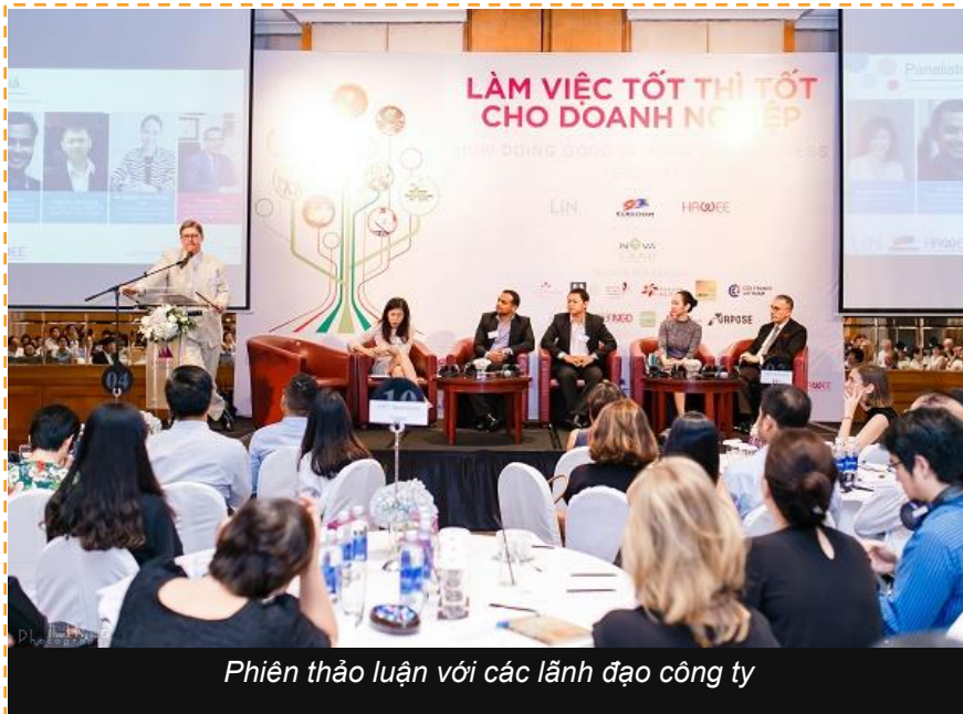
Phiên thảo luận với các lãnh đạo công ty