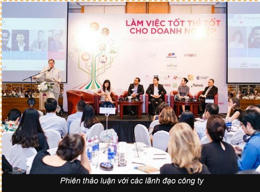
Phiên thảo luận với các lãnh đạo công ty